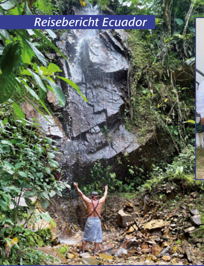
Bei den Schuah hat der Wasserfall eine wichtige Bedeutung – als Ort der Schöpfung Gottes.