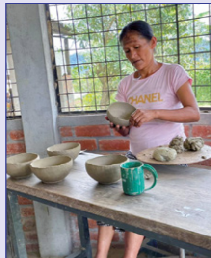
Wir sind zu Besuch bei den Spinnenfrauen, die in liebevoller Handarbeit Schalen töpfern und diese dann bemalen. Für die 12 Frauen ist es ein Treffpunkt und eine Möglichkeit, die Familie finanziell zu unterstützen.

Was mich auf dieser Reise besonders begleitet hat, waren die Gespräche mit den ehemaligen Freiwilligen, die in Deutschland waren und die nun täglich die schwierigen Bedingungen im eigenen Land erleben, die Angst vor Gewalt aber auch die Hoffnung auf Verbesserung.