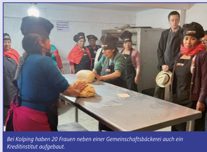
Bei Kolping haben 20 Frauen neben einer Gemeinschaftsbäckerei auch ein Kreditinstitut aufgebaut.

Einige Bilder sollen Euch einen kleinen Einblick meines Besuchs in Ecuador geben – und vielleicht ergibt es sich bei Gelegenheit, persönlich über meine Eindrücke zu berichten.