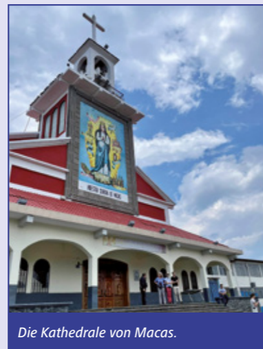
Die Kathedrale von Macas.