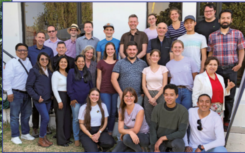
An Tag drei bekamen wir einen Einblick in verschiedene Institutionen der Kirche, aber auch in die politische Situation in Ecuador.